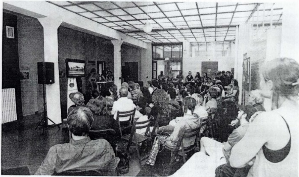
Städtisches Amt und Weltkulturerbe zugleich: Das alte Arbeitsamt am August-Bebel-Platz.