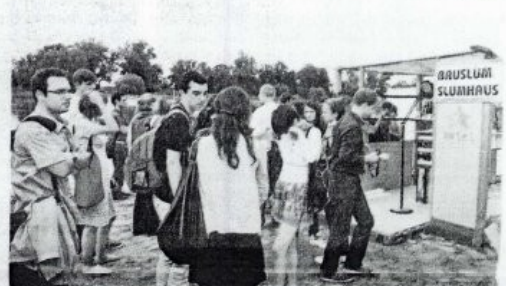
Am Kornhaus findet der Workshop seinen Abschluss.